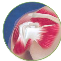
Периартрит мягких тканей