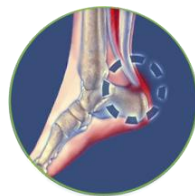
Тендопатия ахиллова сухожилия