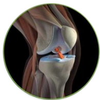
Острые повреждения связок и мышц