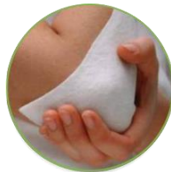
Миогенные триггерные зоны